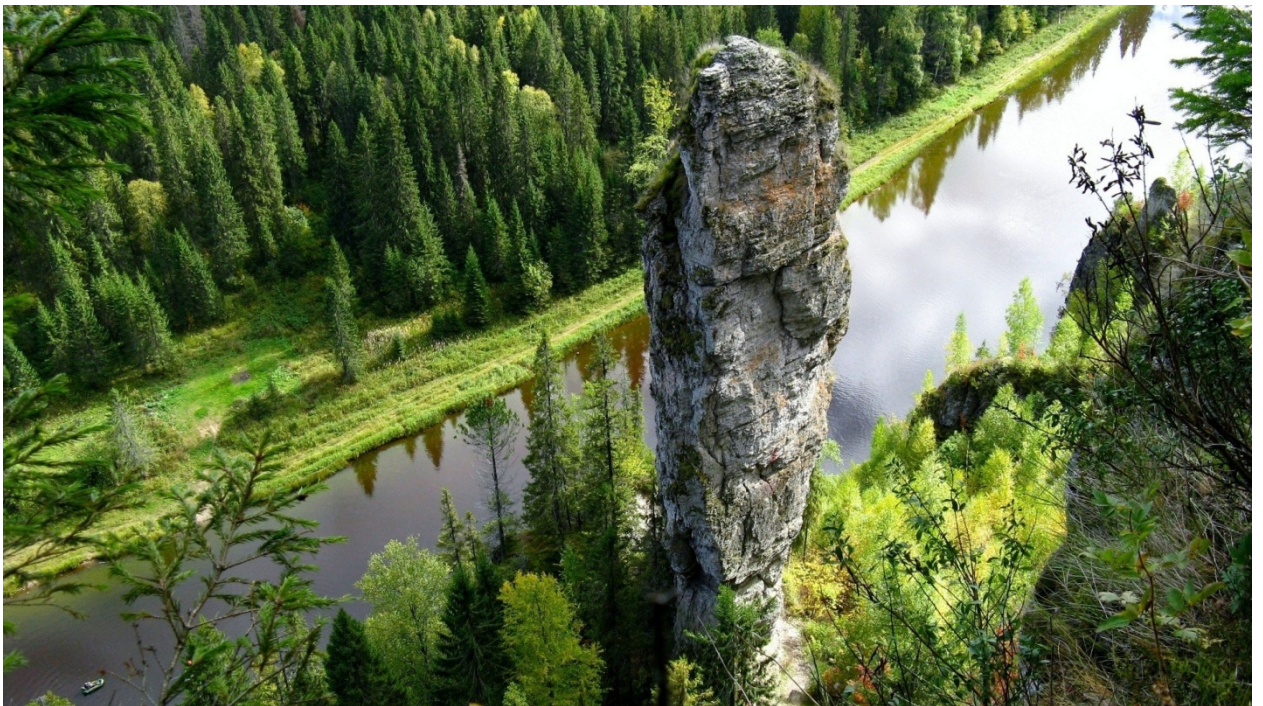
Каменные столбы Усьва Пермский край