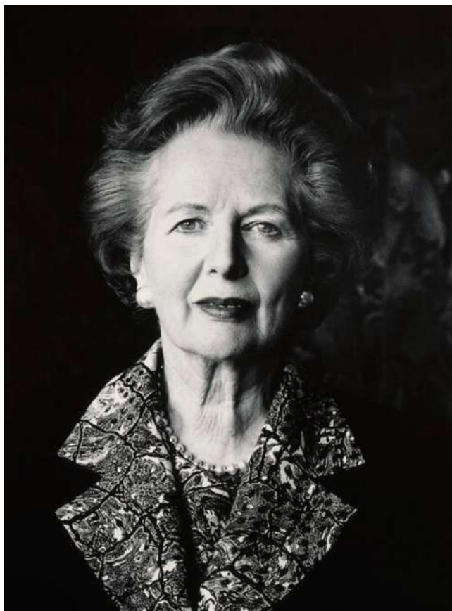
Рис. 1. Фотограф Хельмут Ньютон. Премьер-министр Великобритании Маргарет Тэтчер

Оценка этих фотографий показывает, что они, помимо художественных достоинств, которые едва ли поддаются формализации, имеют ряд формальных признаков, которые влияют на их продвижение в политическом пространстве. Во-первых, на фотографиях зафиксированы личности планетарного масштаба, личности, которые на момент создания фотографий уже были в фокусе внимания широкой общественности. Это обуславливает интерес публики, зрителя к ним. Во-вторых, фотографии смогли показать доминирующие свойства личности, раскрыть индивидуальность. Фотографы смогли реализовать свои творческие замыслы. В-третьих, данным фотографиям удалось победить в конкуренции изображений данных персон, выполненных другими фотографами.