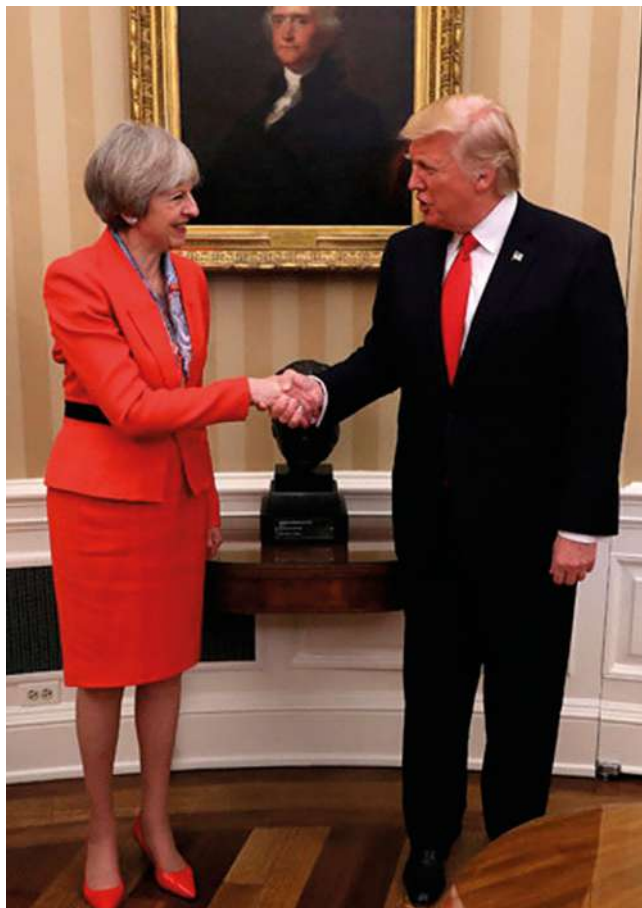
Рис. 3. Президент США Дональд Трамп приветствует Терезу Мэй в Белом доме, 27 января 2017 г.