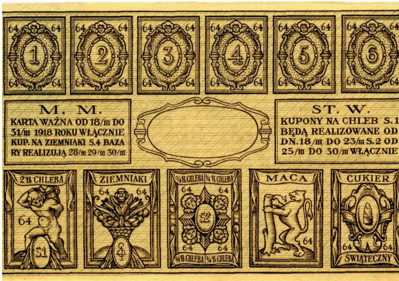
Рис. 1. Продуктовая карта для иудеев с талоном на мацу (таса) на 64-й период распределения. Размер – 85 × 125 мм

ре после введения карточной системы полиция стала сообщать об участвовавших фактах производства и сбыта фальшивых хлебных карт. Они печатались подпольно в разных литографических мастерских. Тиражи этих карт были значительны. В частности, в одном из сообщений полиции в январе 1916 года извещалось об изъятии 1000 фунтов (410 кг) карт, предназначенных для передачи нелегальным торговцам для последующей реализации на черном рынке.