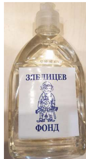
Рис. 1. Рекламный брелок Рис. 2. Часы с рекламой «Единой России» Рис. 3. Рекламные ручки Рис. 4. Зажигалка с рекламой ОПС «Уралмаш» Рис. 5. Средство для мытья посуды с рекламой фонда Е. Зяблицева