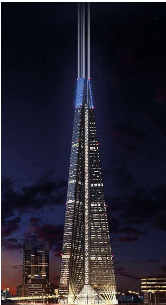
Рис. 1. Проект башни «Россия» для Москва-сити, разработанный бюро Нормана Фостера, предполагал использование света прожекторов для создания эффекта «достижения до небес» в темное время суток. Проект не был реализован. Начатое строительство по ряду причин было прекращено в 2008 году