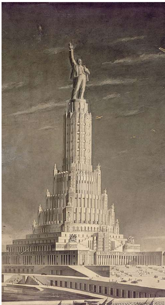
Рис. 2. Конкурсный проект Дворца Советов архитектора Бориса Иофана – образ Вавилонской башни победившего коммунизма, получивший завершение в виде гигантской скульптуры Ленина, простершего руку к недостижимым небесным высям. Проект не был реализован